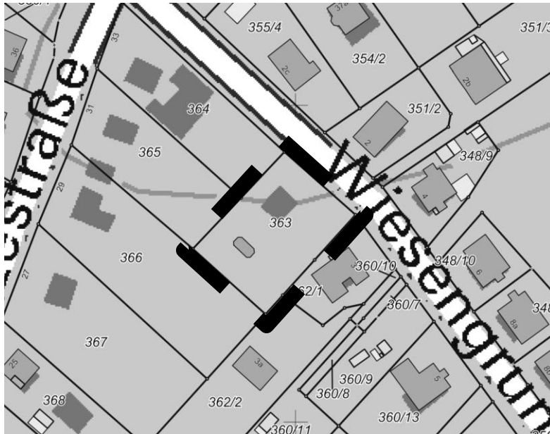
Teilbereich 3, Auszug aus der digitalen topographischen Karte. © GeoBasis DE/M-V 2018

Der Teilbereich 3 liegt ebenfalls im Teilbereich 1 und umfasst das Flurstück 363 der Flur 2 in der Gemarkung Kühlungsborn. Hier wird statt des bisherigen WA 2 das WA 5 festgesetzt.